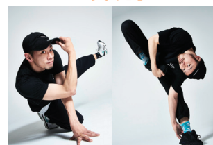
ダンサーの活動を間近で見学！

+ 日時 全8回 (すべて日曜日/10:00-17:30) 2022年 11月20日、12月4日、18日、2023年1月8日、15日、29日、2月5日、19日