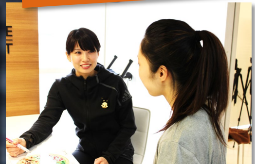
最新情報提供、多業種との出会いと連携、 サービス化、イベント開催など！