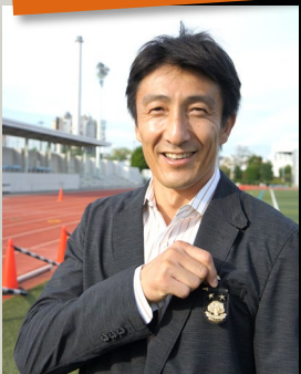
北京五輪のメダリスト 朝原宣治さんも取得！