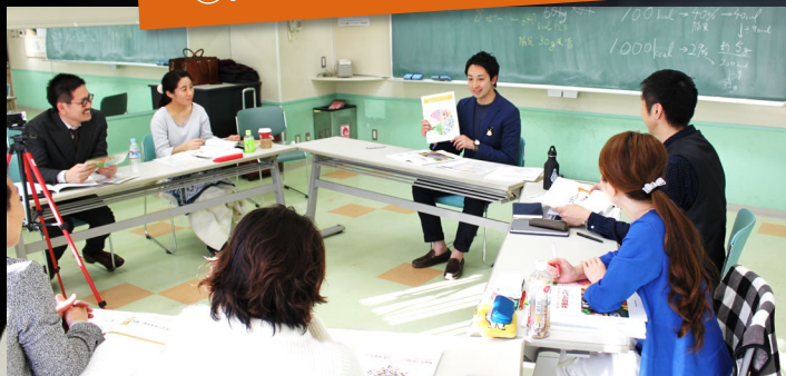
わかりやすい教材と様々なツールで 基礎から応用まで楽しく学習！